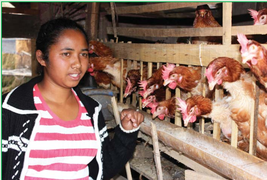
Une des bénéficiaires du projet "Femmes et Entrepreneuriat", commune urbaine de Manjakandriana.

Mampianina a osé dire non à la violence et prendre sa vie en main. Malgré un lourd passé, elle a surmonté tous les obstacles et a concrétisé ses projets.