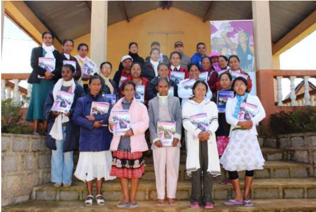
Figure 1: Mpandray anjara nandritry ny fiofanana

Firenena: Madagasikara Koaminina: Andriampamaky Daty: 08, 09, 10 Aogositra 2013