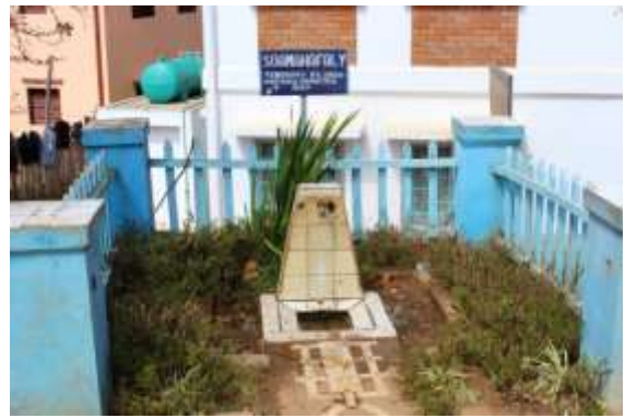
Figure 2: Fatsakana Ambohitrony, Andriampamaky