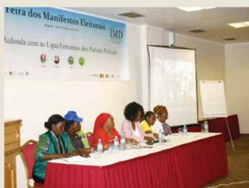
Partidos políticos discutem inclusão da mulher nos seus projectos

O Instituto para a Democracia Multi Partidária (IMD), em coordenação com a Associação Mulher, Lei e Desenvolvimento, organizou há a Feira dos Manifestos Eleitorais, com vista a partilhar o papel das mulheres das ligas femininas dos partidos políticos para inclusão de questões de gênero nos programas de governação para o quinquênio 2019-2024. O IMD entende que a mulher enfrenta vários desafios para inserção na política que, nalguns casos, têm a ver com questões culturais, educação e ou pobreza, em que se defende que a liderança é só para homens, e falta de recursos e incentivos. Considera-se, ainda, que o nível de disciplina partidária e a sensibilidade das lideranças contribuem para a inclusão da mulher nos processos eleitorais, sem deixar de fora o facto de muitas vezes aliar-se a ascensão aos cargos de liderança à corrupção. Os partidos Frelimo, Renamo, MDM e Nova Democracia, representados no evento, exclusivamente por mulheres, apresenta-