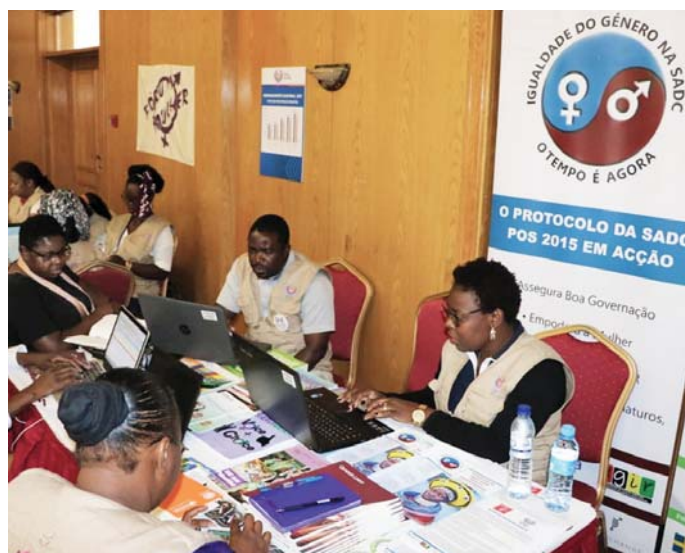
Gender Links de Gênero Moçambique monitorando o gênero nas eleições.

Sala da Paz incluiu organizações da sociedade civil como Gender Links, Muleide, Fórum Mulher e Instituto de Democracia de Moçambique como Secretariado. Um desenvolvimento importante nesta eleição foi a criação de um task force de gênero que monitorou questões específicas de gênero durante as eleições.