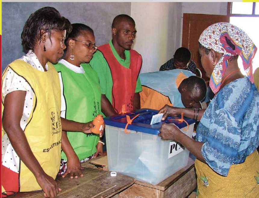
As mulheres constituem 53,5% do eleitorado, mas estão ausentes nos manifestos do partido e na mídia.