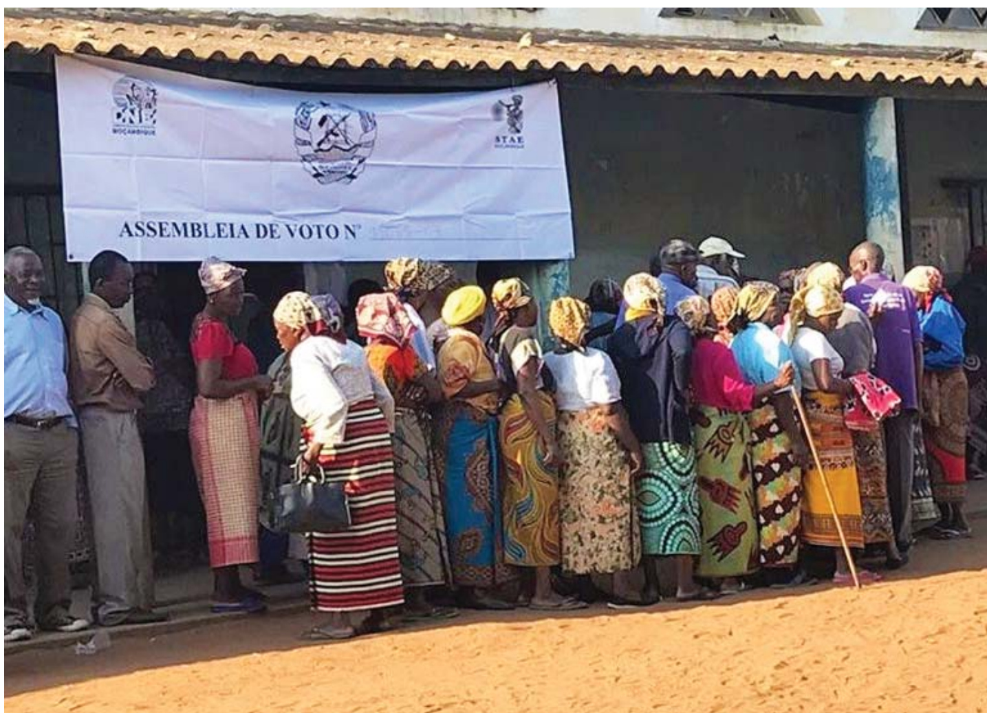
Mulheres na fila para exercer o seu direito de votar.

O Estado reconhece o valor e vai incentivar a participação das mulheres na defesa do país e em todas as esferas da actividade política, econômica, social e cultural do país. O artigo 69 proíbe e torna puníveis acções que atribuem privilégios ou criam discriminação com base no sexo.