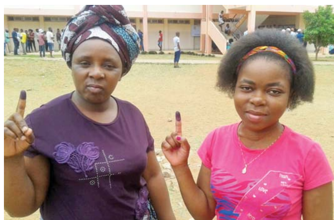
Mulheres orgulhosamente exibem sua marca depois de votar em Moçambique.