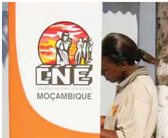
A CNE faz grandes esforços para garantir que seus materiais tenham consciência de gênero.

A baixa participação de eleitores nas eleições de 2019 é uma preocupação séria. Do total de 12 945 921 eleitores registados, apenas 6 121 339 votaram, o que representa 47% do total de eleitores registados. A baixa participação dos eleitores geralmente indica apatia entre os cidadãos. Isso requer atenção antes das eleições de 2024. Os partidos políticos devem começar a ter como alvo as mulheres eleitoras nos seus manifestos e garantir que as mulheres constituam pelo menos metade dos que figuram nas suas listas de partidos.