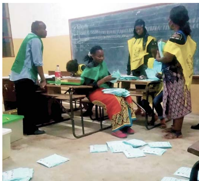
Processo de contagem de votos - Eleições de Moçambique.

O Artigo 122 (1) da Constituição concede a todos os homens e mulheres direitos iguais para ocupar cargos públicos e políticos. Moçambique é oficialmente um sistema multipartidário, que atualmente tem três partidos principais, embora dominado pelo governo da FRELIMO desde a independência. Na Constituição ou nas leis eleitorais, não há exigência para que os partidos políticos tenham cotas para as mulheres. Isso é deixado como uma decisão voluntária para os partidos. Isso significa que as disposições constitucionais estabelecidas no artigo 122 não são totalmente implementadas pelos partidos políticos.