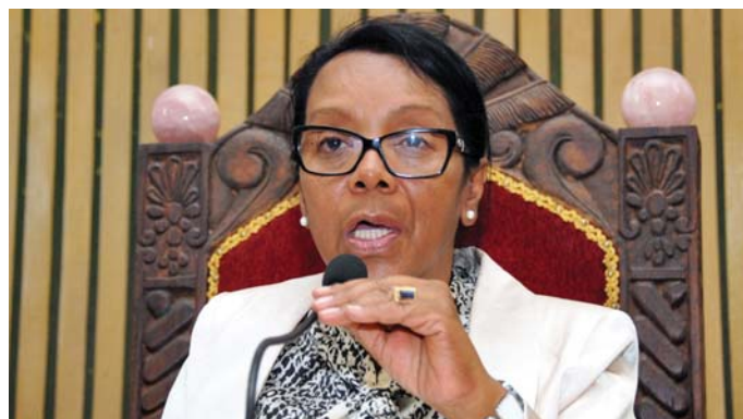
RAZANAMAHASOA Christine, Filohan'ny Antenimieram-pirenena.

Vehivavy ny filohan'ny Antenimieram-pirenena amin'izao fotoana izao, Razanamahasoa Christine.