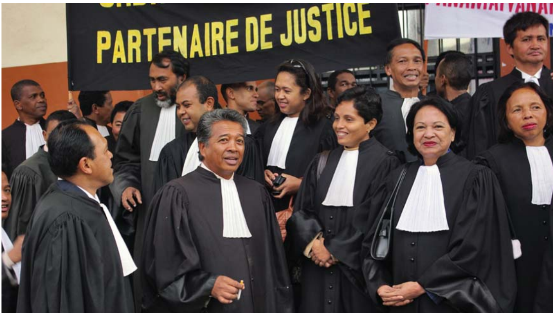
Sasany amin ireo mpisolovava eto Madagasikara.