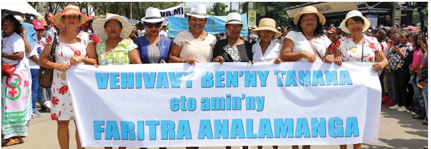
Manao diabe ho an'ny fitoviana ny ben'ny tanàna eto Madagasikara.

Tamin'ny fifidianana filoham-pirenena tamin'ny taona 2018, ny vehivavy dia nandrafitra ny 46% amin'ireo mpifidy 9.767.098. Ary 48% ihany no mpifidy nandatsa-bato tamin'ny fifidianana filoham-pirenena. 25