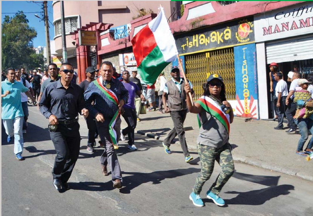
8 martsa fankalazana ny andro iraisam-pirenena ho an'ny vehivavy Antananarivo.