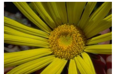
Légende accompagnant l'illustration.

L'image que vous choisirez devra être placée près de l'article et accompagnée d'une légende.