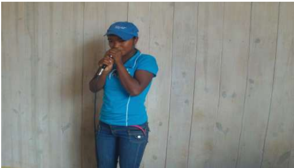
SANTIONANY AMIN'NY SEHO AN-TSEHATRA

Natao seho an-tsehatra narahina fifanakalozan-kevitra ireo tranga roa ireo ary hita fa nahafinaritra ny fandraisana anjaran'ny mpiofana ary tafita ny hevitra tiana ahatongavana.