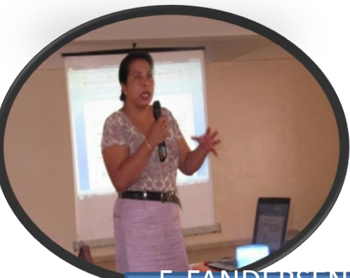
5-FANDERSEN-DAHATRA NY TEKNISIANA