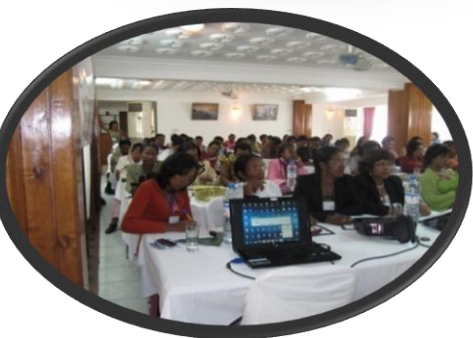
6- FANEHOANA NY TARI-DALANA T@ VEHIVAVY KANDIDA