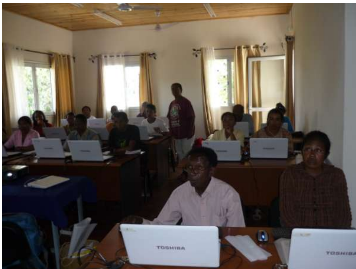
Les participants durant la formation