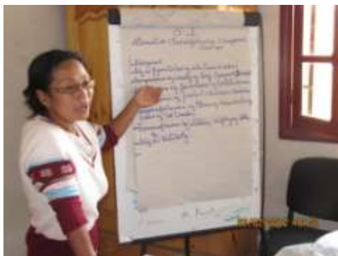
Figure 4: Fanehoana ny vokatry asa tarika