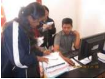
figure 7: fampianarana internet

Marihina fa nifanampy tamin'ny mpizaika ny tao @ CSA Soavinandriana t@ fanaovana ny kaonty e-mail ary ny fampianaran ny internet.