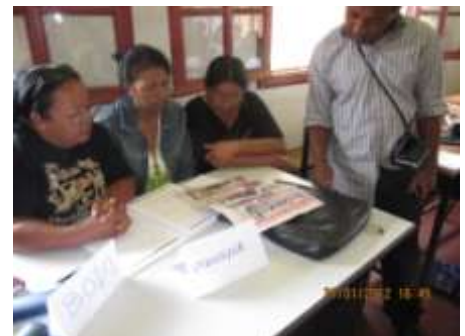
Figure3: asa tarika