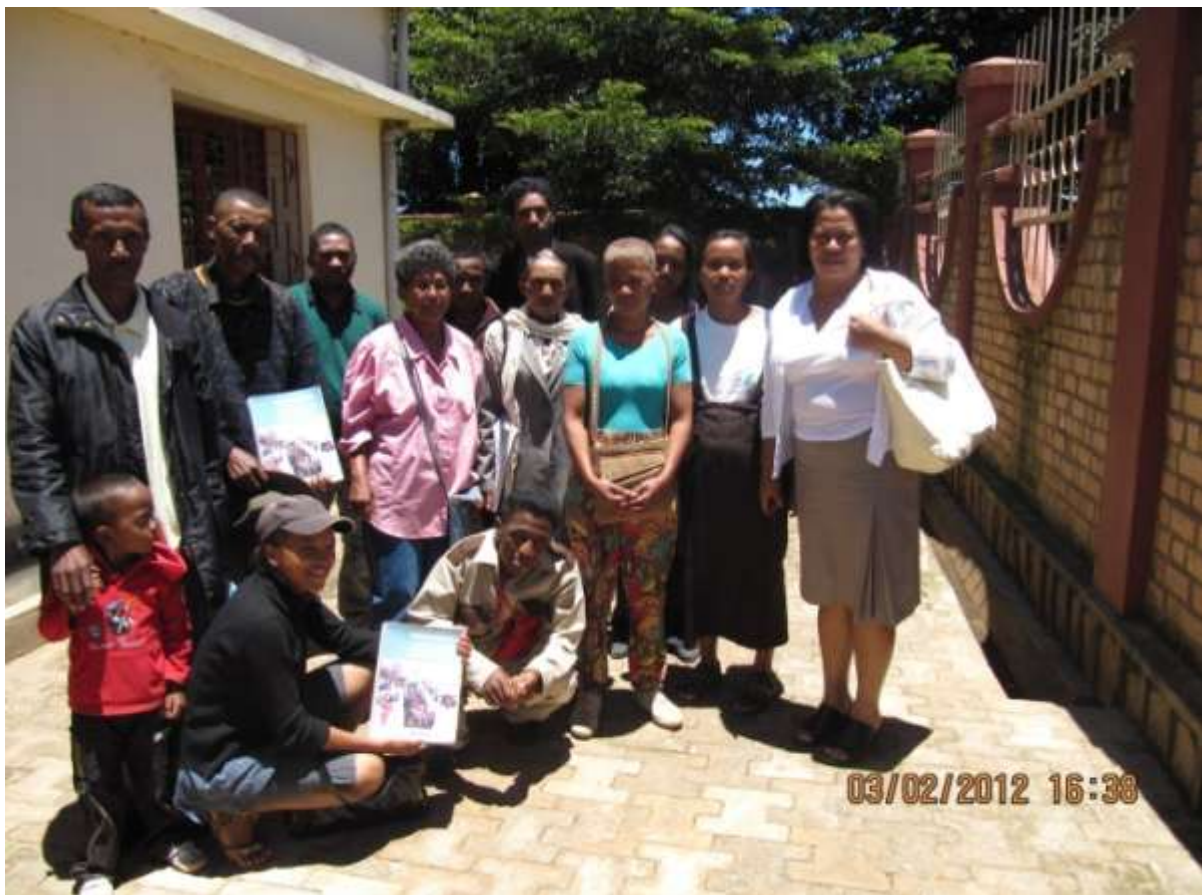
Figure 1: Ireo komity ny Miralenta