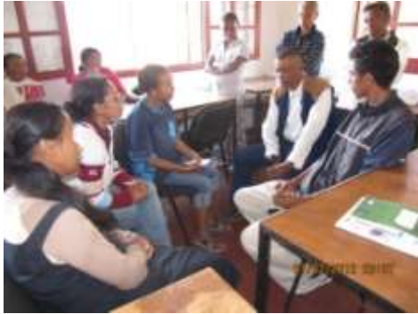
Figure 6: seho antsehatra t@ fandravonana disadisa