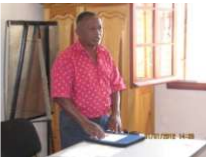
Figure 2: Ben'i tananan'i CU Soavinandriana

Natrehan' ny Ben'ny tanana ny fanokafana ny atrik'asa