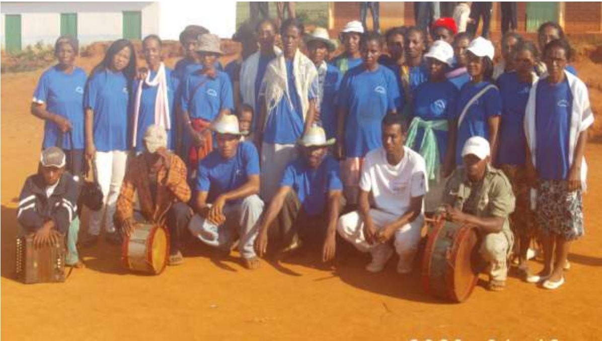
Figure 1: Atelier stage 5-7-8 et bonnes pratiques Ambohimirary