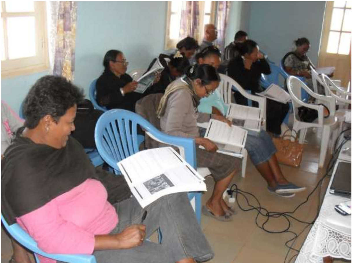
Mpandray anjara nandritra ny fiofanana