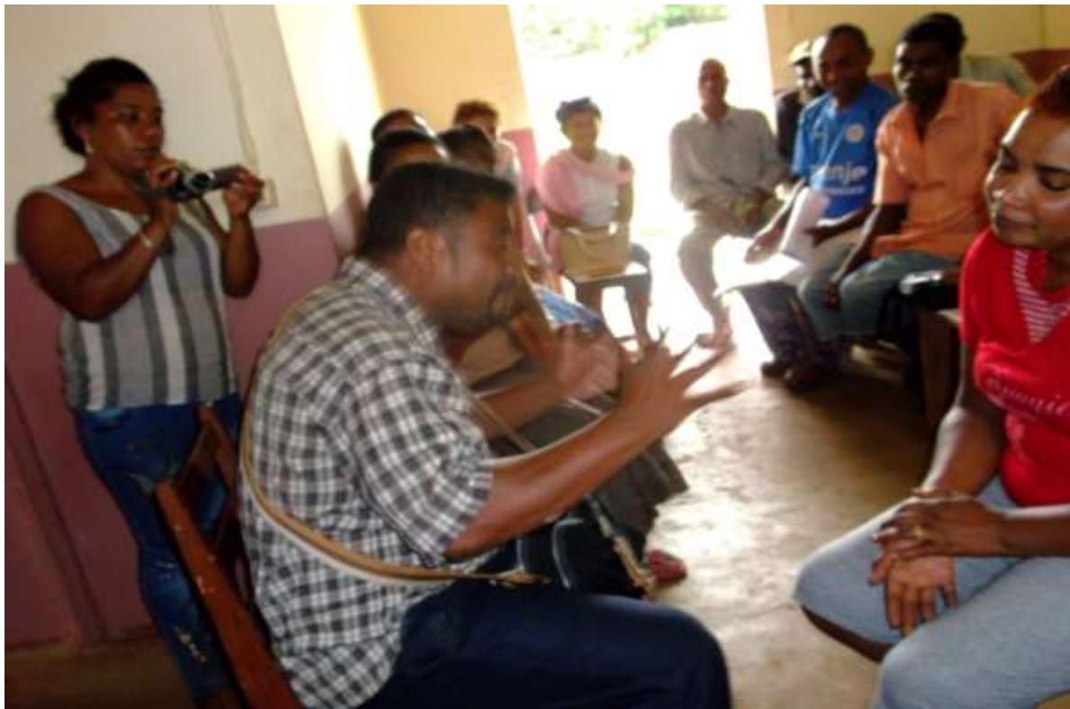
Ireo Mpizaika sy ny mpanao gazety

Daty: 05-06-07 Mai 2015 Toerana: Biraon' ny Kaominina JOFFRE-VILLE